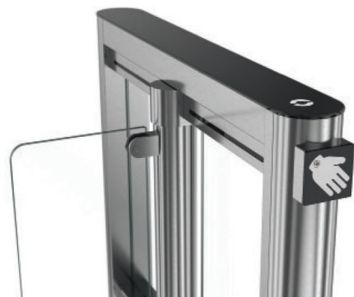
Установка датчика измерения температуры запястья на фронтальную крышку стойки корпуса (EasyGate SG 1000)