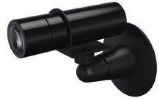
Дизайн тепловизионной камеры