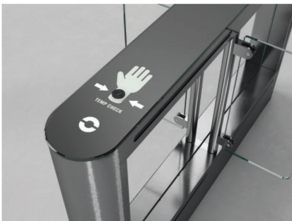
Внедрение датчика измерения температуры запястья в верхнюю панель корпуса (EasyGate SPD)

Сигнал тревоги, информирующий о высокой температуре человеческого тела, может быть отображен в программе Tmon, а также отправлен в систему сторонних производителей.